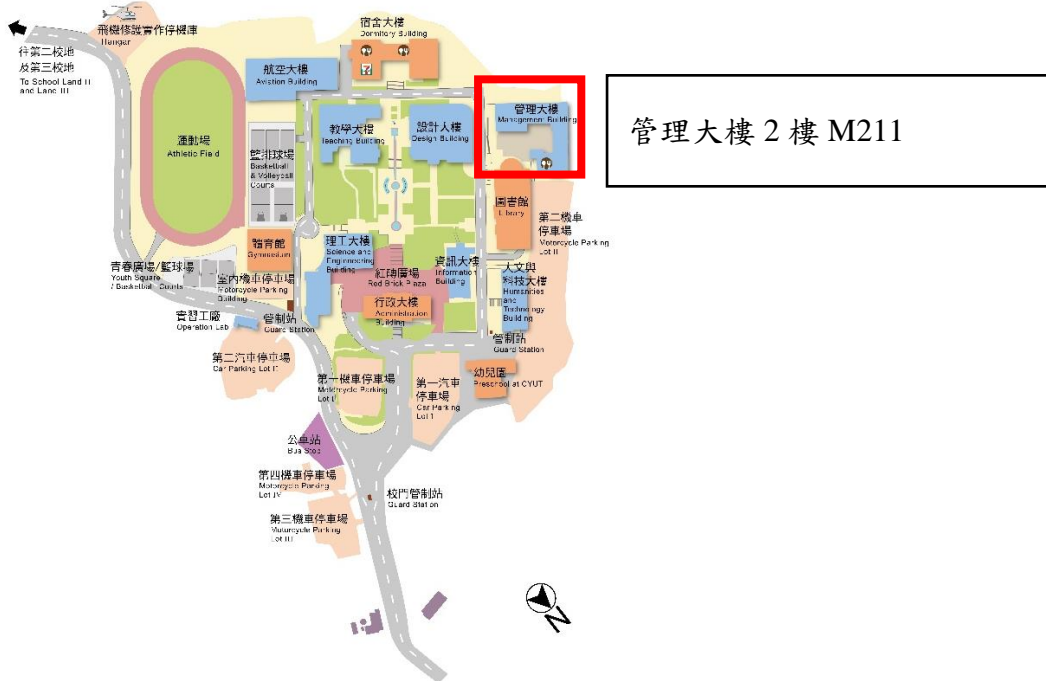
朝陽科技大學平面圖 Campus Map of Chaoyang University of Technology